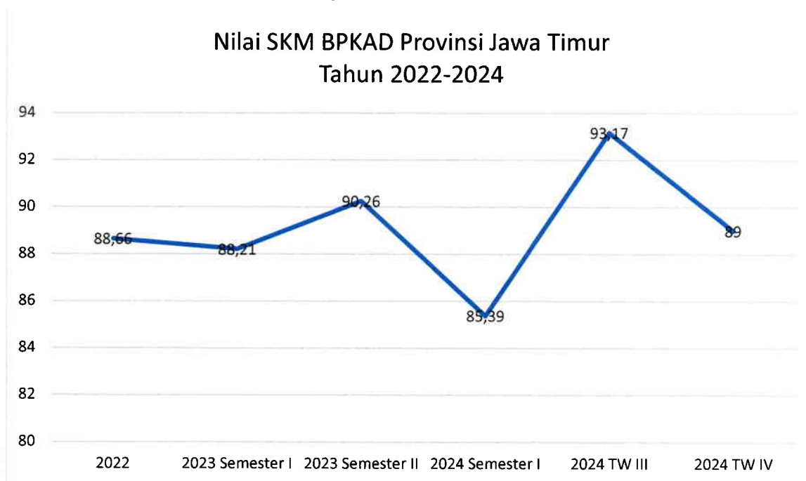
Grafik 2 Tren Nilai SKM

Berdasarkan grafik di atas, dapat disimpulkan bahwa nilai SKM pada Badan Pengelola Keuangan dan Aset Daerah Provinsi Jawa Timur mengalami dinamika yang naik turun. Pada tahun 2022 Badan Pengelola Keuangan dan Aset Daerah Provinsi Jawa Timur memperoleh nilai SKM sebesar 88,66 dengan predikat Baik, nilai tersebut didapatkan dari hasil survei sejumlah 46 pengguna layanan. Sementara itu, pada tahun 2023 Semester I Badan Pengelola Keuangan dan Aset Daerah Provinsi Jawa Timur mengalami penurunan nilai menjadi sebesar 88,21 dengan predikat Baik, nilai tersebut didapatkan dari hasil survei sejumlah 64 pengguna layanan. Selanjutnya, pada tahun 2023 Semester I Badan Pengelola Keuangan dan Aset Daerah Provinsi Jawa Timur berhasil meraih nilai sebesar 90,26 dengan predikat Sangat Baik. Nilai tersebut didapatkan dari hasil survei sejumlah 177 pengguna layanan selama Tahun 2023. Selanjutnya, pada Semester I Tahun 2024 mengalami penurunan menjadi 85,39 dari survei terhadap 333 pengguna layanan. Sementara itu, pada tahun 2024 Triwulan III mengalami peningkatan menjadi 93,17 dari survei terhadap 74 Pengguna Layanan. Penilaian terakhir pada Triwulan IV 2024, nilai SKM mengalami penurunan menjadi 89 dari survei terhadap 657 Pengguna Layanan.