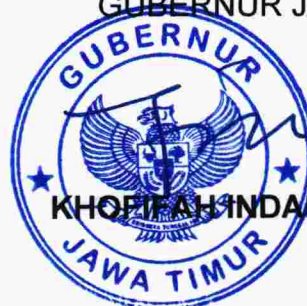
KHOIRAH INDAR PARAWANSA